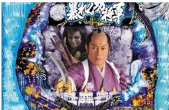
(C)東映, (C)Fuji Shoji