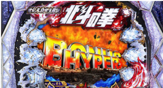
(C) 武論尊・原哲夫/NSP 1983, (C)NSP 2007 著作権許諾証 YDA-108, (C)S a m m y